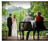
Asistencia en eventos de mayores y enfermos. Bodas, celebraciones, etc. ¡Les recogemos, atendemos y llevamos a casa!