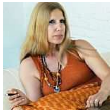
El guardián del secreto de la Duquesa: «Sus hijos quieren estar...» La Razón