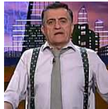
La "floja reacción" de Wyoming en 'El Intermedio' tras el... El Economista