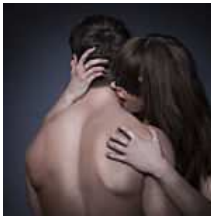
¿Qué signos del zodiaco gozarán de más pasión en 2015? El Mundo.es