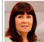
MICAELA NAVARRO Presidenta del PSOE 06/02/2015