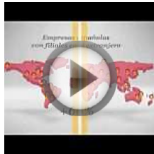
Claves de la internacionalización de las empresas... PWC en YouTube