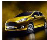
Final de Stock 2014 Llévate un Ford Ka o un Ford Fiesta con un 30% DTO.