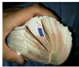
9.745 € por mes? ¡En Madrid, una madre soltera gana 9.745 € por mes desde su casa!