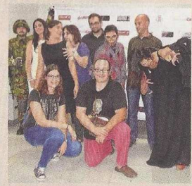
Presentación de Apocalipsis Zombie.

►Como si de la serie The Walking Dead o de la película Guerra Mundial Z se tratase, un Apocalipsis Zombie se adueñará de Osuna el próximo 20 de junio, gracias a una «experiencia pionera» puesta en marcha por la empresa de turismo Plan 60 segundos en colaboración con la delegación de Turismo del Ayuntamiento. Los participantes en la iniciativa, que se desarrollará durante toda la noche, deberán resolver un conjunto de pruebas y enigmas en su recorrido por la localidad, siendo una forma «diferente de conocer las calles y los espacios turísticos» osunenses.